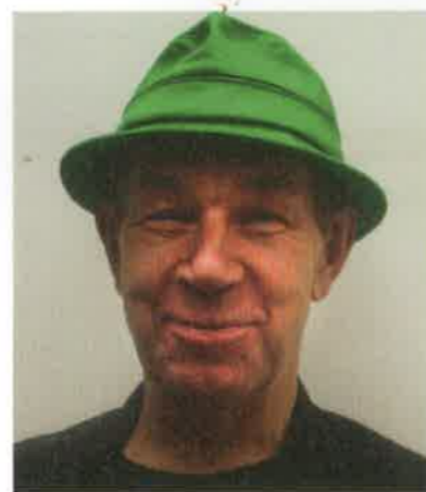
Unten: Das Cabinet der Scharlatane